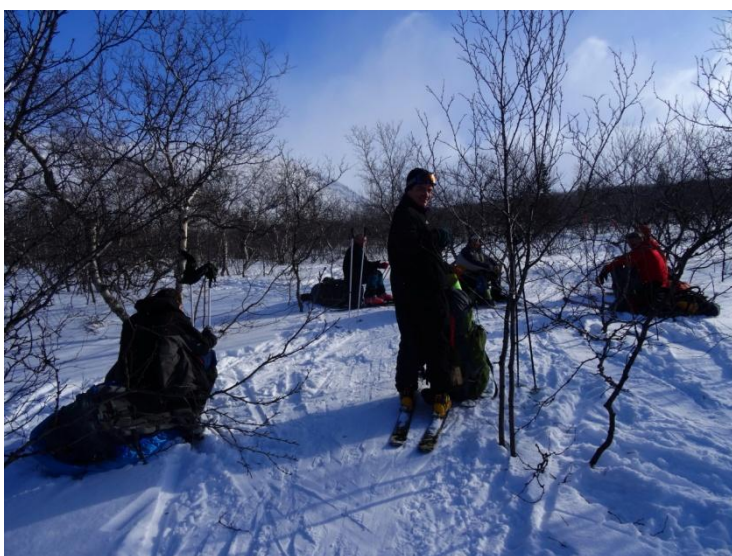
Фото 7. Привал группы при подъеме на пер. Южный Чорргор. Фото на восток.

Перешли р. Меридиональный в месте, где образовался крепкий снежный мост, технической сложности переправа не представляла. Далее таким же образом совершили переправу через р. Часнайок и продолжили движение по его левому берегу по проторенной лыжне. Направление лыжни и движения – северо-запад - юго-восток, в сторону р. Кунийок, через пер. Южный Чорргор (1Б, 850м). Угол 10°, плавный набор высоты.