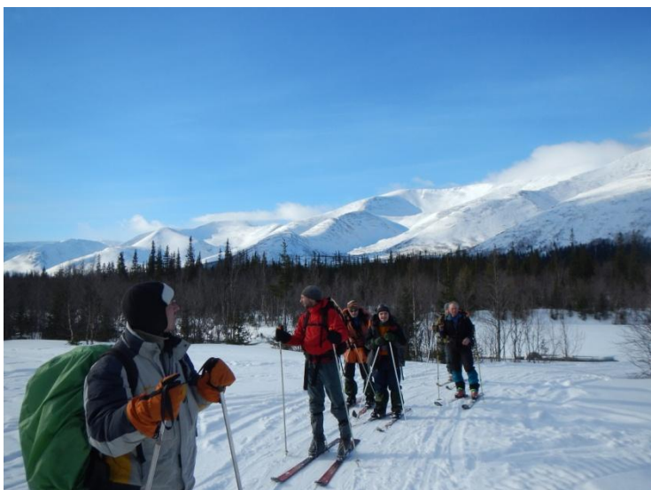
Фото 11. На пути к Базе КСС из лагеря. Фото на юг.

Дорога вдоль реки Кунийок идет по левому берегу, дорога достаточно широкая, хорошо укатанная снегоходами, проходит мимо базы ПСО (База КСС). Направление дороги движения с юга на север в сторону г. Кировск через перевал Сев. Рисчорр (н/к 680 м). На пути к запланированному перевалу, группа пообедала (перекусила).