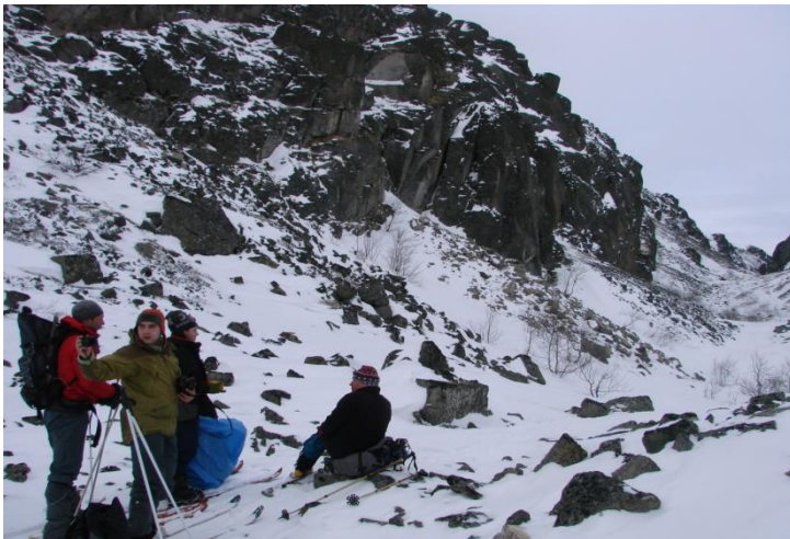
Фото 6. Группа на привале в расщелине Аку-Аку.

Спуск к оз. Имандра представлял техническую сложность для некоторых участников в связи с поломкой креплений (скигур) и отсутствием у нескольких участников опыта спуска с перевала на лыжах. Спуск прошел успешно.