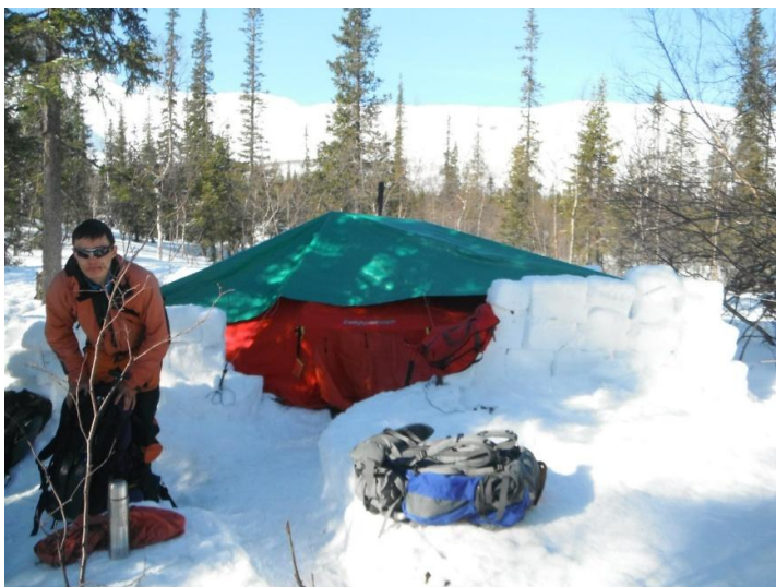
Фото 15. Сборы и выход из лагеря

Подъем группы в 7.30. Завтрак, сборы, выход на маршрут в 9.00.