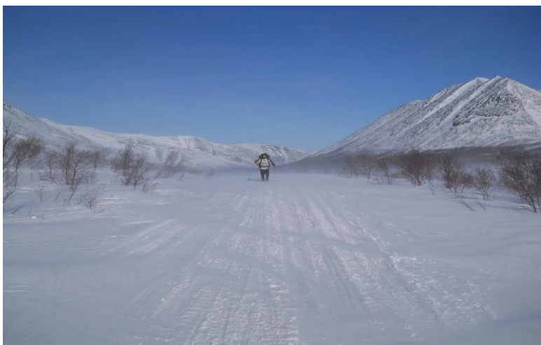
Фото 19. Движение группы на подъеме к пер Кукисвумчорр(н/к, 480м) в тяжелых климатических условиях при сильном ветре 15м/с. Фото на север, в д/р Кунийок.

Перевальное седло – широкий разлом между массивами Кукисвумчорр, с востока, и Поачвумчорр, с запада. Перевал Кукисвумчорр(н/к, 480м) соединяет д/р Кунийок с севера и д/р Вудъяврйок с юга. Так как с запада на восток в Хибинах этот перевал самый низкий и господствующие ветра север-юг, то часто на перевале очень сильный ветер и тяжелые погодные условия.