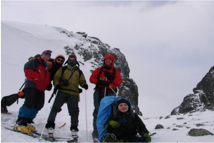
Фото 5. Группа на перевале Юмьекор(н/к, 671,5м).

Фото на северо-запад, в сторону расщ.Аку-Аку)