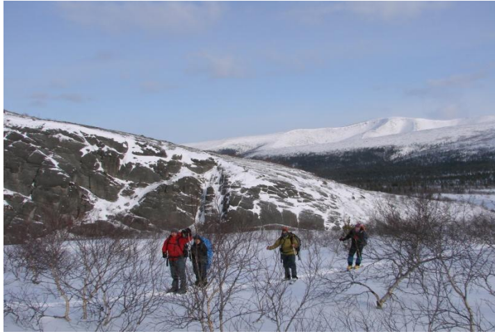
Фото 4. Движение группы на подъеме к перевалу Юмьекор(н/к, 671,5м).

Фото на северо-восток, на д/р Меридианальный)