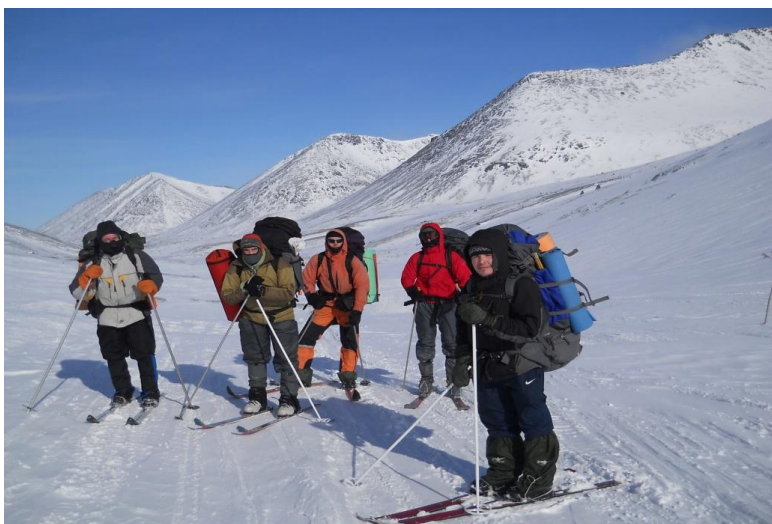
Фото 20. Группа на пер Кукисвумчорр(н/к, 480м). Фото на север.

Перевальное седло – широкий разлом между массивами Кукисвумчорр, с востока, и Поачвумчорр, с запада. Перевал Кукисвумчорр(н/к, 480м) соединяет д/р Кунийок с севера и д/р Вудъяврйок с юга. Так как с запада на восток в Хибинах этот перевал самый низкий и господствующие ветра север-юг, то часто на перевале очень сильный ветер и тяжелые погодные условия.