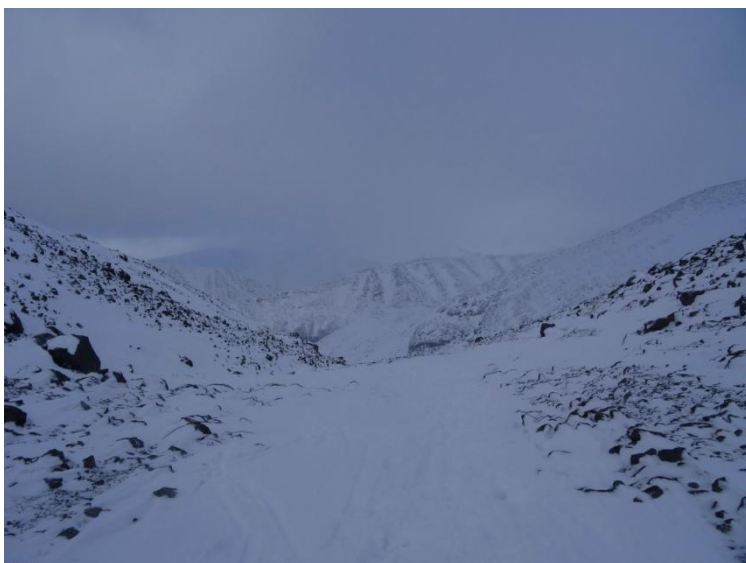
Фото 8. На пер. Южный Чорргор. Расположен в глубокой седловине между вершинами Иидичвумчорр и Часначорр. Фото на восток, в сторону р. Кунийок.

Перед финальным взлетом группа пообедала-перекусила и с минимальными затруднениями поднялась на перевал, угол 30^\circ с резким набором высоты, где сняла перевальную записку от группы туристов из Москвы ТК ВШЭ .