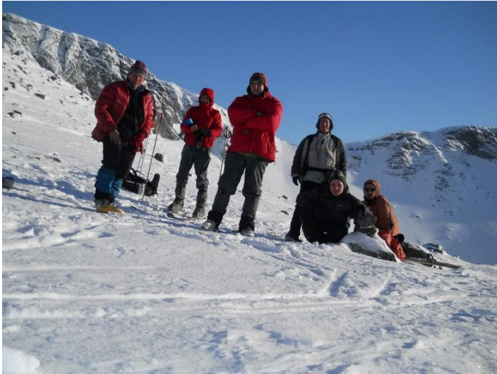
Фото 17. Группа на пер. Восточный Петрелиуса (н/к, 883м). Фото на запад.

Группа поднялась на перевал в 16.10. Перевальное седло – плавный переход горы Петрелиуса (с западной стороны) в скальный массив с восточной стороны (в более южной части он переходит в массив Поачвумчорр).