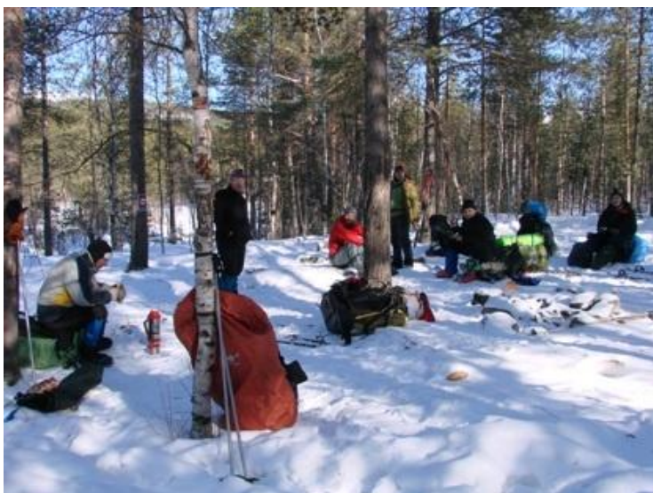
Фото 3. Группа на обеденном привале. Фото на северо-восток.

Скорость передвижения была средняя, т.к многие участники имели опыт лыжных походов, проверили снаряжение еще в городе. Во время длительных привалов были проведены занятия по темам: передвижение в лыжном походе, тропление свежего снега, безопасность и техника движения по ледовым мостам. 13.25 – 14.15 Обед.