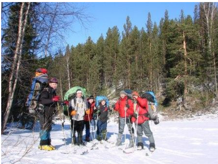
Фото 2. Группа на р. Гольцовка. Фото на север.

Дальше шли в основном по хорошей тропе, местами по «буранке» вверх по р. Гольцовка. Встречали много туристических групп.