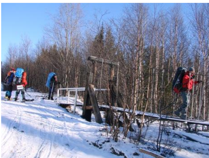
Фото 1. Переход группы по мосту через р. Гольцовка. Фото на северо-восток.

Практически сразу после начала движения вышли по хорошей тропе к подвесному мосту через р. Гольцовку и перешли по нему на левый берег. По которому и продолжили движение вверх по течению реки.