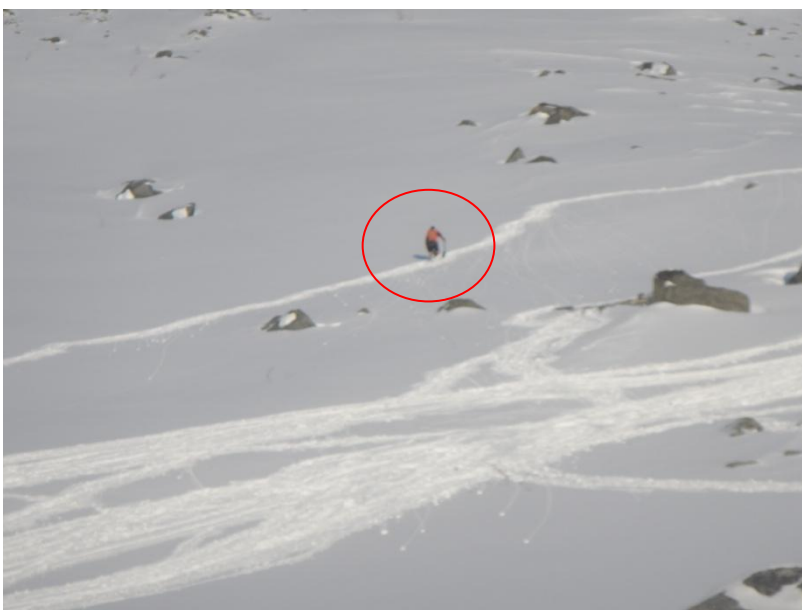
Фото 14. Лавинные занятия. Вид на северный склон Сев. Рисчорра.

Фото 13. Перевал Сев. Рисчорр. Вид на восток, на Ловозёрские тундры. Спуск с перевала Сев. Рисчорр (н/к 680 м) на юг к лагерю пролегает по тому же маршруту что и выполненный подъем. Спуск был совмещен с проведением лавинных занятий под перевалом. Руководитель в невидимой зоне от участников закопал в снег бипер. Участниками успешно проведена работа по его обнаружению с использованием биперов и лопат. Затем руководитель закопал рюкзак в зоне большого количества лыжней, обозначив таким образом место схода лавины. Участники с помощью лавинных зондов и лопат обнаружили «пострадавшего».