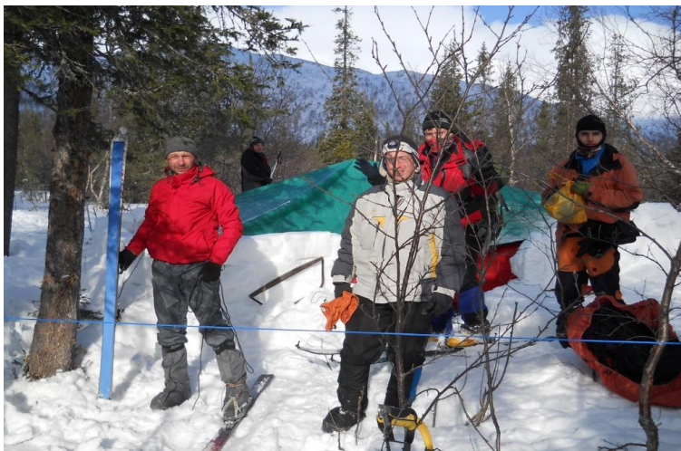
Фото 18. Лагерь группы в д/р Кунийок.

Подъем группы 7.00. Завтрак, сборы. Выход на маршрут 9.30.