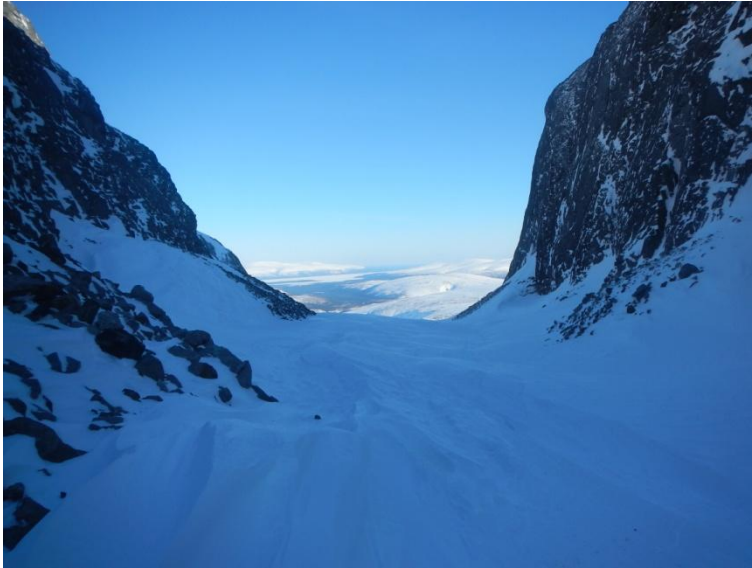
Фото 13. Перевал Сев. Рисчорр. Вид на восток, на Ловозёрские тундры. Спуск с перевала Сев. Рисчорр (н/к 680 м) на юг к лагерю пролегает по тому же маршруту что и выполненный подъем. Спуск был совмещен с проведением лавинных занятий под перевалом. Руководитель в невидимой зоне от участников закопал в снег бипер. Участниками успешно проведена работа по его обнаружению с использованием биперов и лопат. Затем руководитель закопал рюкзак в зоне большого количества лыжней, обозначив таким образом место схода лавины. Участники с помощью лавинных зондов и лопат обнаружили «пострадавшего».