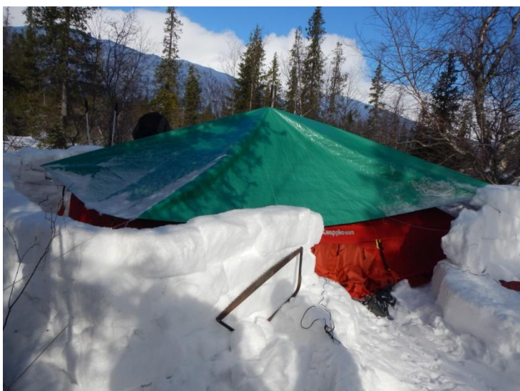
Фото 10. Утро. Лагерь группы р. Кунийок 4-5 км южнее Базы КСС

Подъем группы 8.00. Завтрак, сборы. Выход на маршрут 09.30.