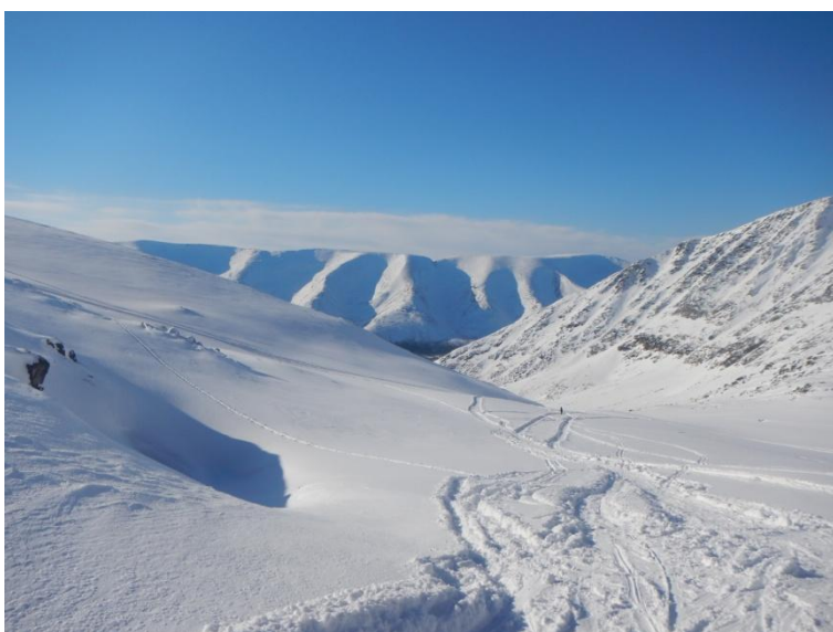
Фото 12. Пер. Сев. Рисчорр (вид на запад)

Подъем на перевал Сев. Рисчорр (н/к 680 м) не представляет технической сложности, угол подъема 10-30°, набор высоты от Базы КСС плавный, у основания перевала уклон до 30°, затем снова плавный подъем.