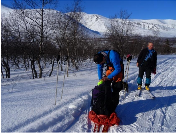
Фото 16. Группа на привале через 40 минут движения в д/р Кунийок. Фото на северо-запад.

Дорога в д/р Кунийок проходит по правому берегу, широкая, укатана лыжниками и снегоходами. Направление дороги север-юг, направление движения до подъема на перевал – юг, при спуске и возвращении в лагерь – север.