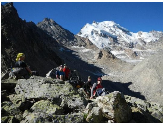
на фоне г. Думала.