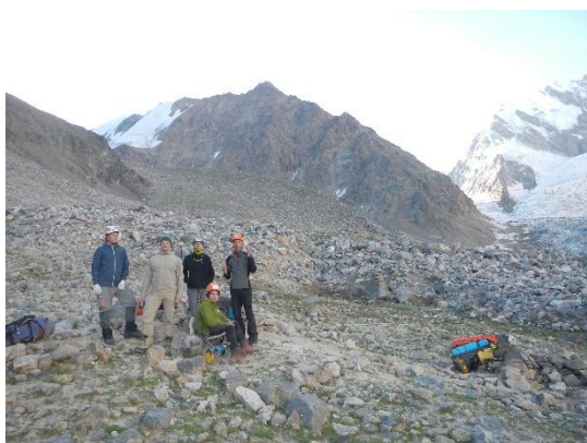
фото 22. Участники на фоне п. Варшава, фото на восток.

Не доходя до места слияния западной и восточной ветвей ледника, перед правобережным ледопадом, необходимо повернуть на юго-восток. Подойдя к осыпи правобережной марены, группа обнаружила тропу, уходящую вверх к стоянкам у озера. Это ночевки на повороте, группа была в 15.10. Подъем по тропе достаточно опасен и крут. В этом месте много готовых площадок для ночевки. Обед до 16.00. К Джанги-кошу группа подошла в 18.15. Высота 3250 м. За день прошли 16 км и набрали 1000 м. Очень тяжело.