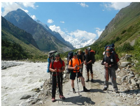
фото 25. Группа на фоне верш. Гестола.

Подъем группы в 7.30. Выход на маршрут в 10.00. Из а/л Безенги по грунтовой дороге группа направилась вниз, в сторону поселка Безенги, вдоль реки Черек-Безенгийский.