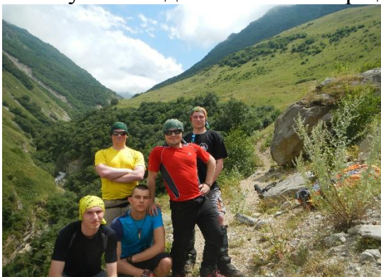
фото 1. Группа на фоне д/р Думала.

Заказанная “Газель” забрала группу в МинВодах и высадила на слиянии рек Черек Безенгийский и Думала, около бетонного мостика. От него ведет дорога к дому лесника, там была проверка документов – разрешение на посещение заповедника(время 12.30.). Дальше тропа идет серпантинном по склону и выводит на левый борт д/р Думала.