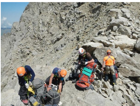
фото 16. Группа на пер. Янгеля(2А, 3689м), фото с юга.

Перевал Янгеля(2А, 3689м) находится в северном отроге от в. Гидантау и соединяет д/р Укюсы с юго-востока и д/р Жюрюшкюсу с северо-запада. Подъем с юго-востока – некрутой 25^{\circ} - 30^{\circ} осыпной склон. Сам перевал – небольшой разлом в массиве. Тура нет. Группа была на перевале в 11.40.