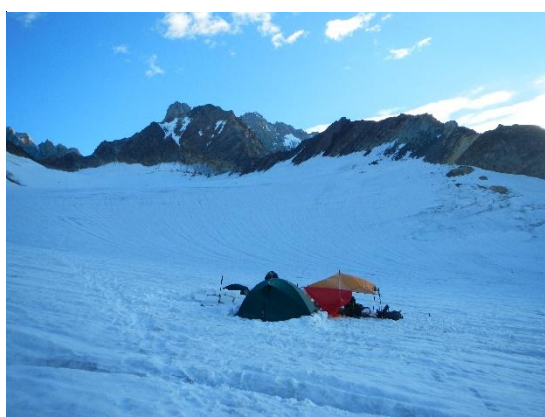
фото 23. Вечер, лагерь на фоне в. Башхааус, высота 3950 м, фото на север.

Подъем группы в 4.00. Выход в 6.10. Группа хотела по насту пройти снежно-ледовую часть ледника. На Джанги-кош были спасатели. Узнав наш маршрут, они нас отговаривали идти через пер. МВТУ(2А, 4110м), причину не объясняли, говоря, что там совсем плохо. Они же нам советовали, как можно раньше пройти под п. Варшавой (камнеопасно, сыпет). От приюта тропа идет по правому борту, то снег, то осыпь. После п. Варшава, начинается закрытый ледник, группа связалась(3522 м, 8.10.). В 9.30. группа остановилась на 3950 м на ночевку. Место ровное, безопасное, около пер. Камнепадный. Рядом проходила спусковая альпинистская тропа с п. Селлы и в. Башхааус. Зная о надвигающейся грозе, обустроивали лагерь снежными стенами. Днем – гроза, град, сильный ветер, у нас обед.