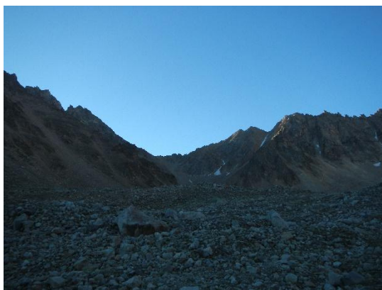
фото 4. Вид на пер. Укю - Думала(1А, 3542м) под конечной мореной ледника Укю, фото на восток.

Подъем группы в 6.30, выход группы в 8.30. Тропы нет, группа двигалась по боковой, восточной марене ледника Укю.