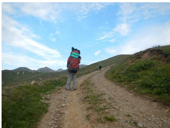
фото 28. Группа в долине реки Удурсу.

Дорога выходит на верх хребта и ведет в ур. Чегетджара. На всем протяжении по хребту воды нет. На высоте 2800 м имеются верховые болота, там группа остановилась на ночлег в 18.50., есть родники, много минеральных источников.