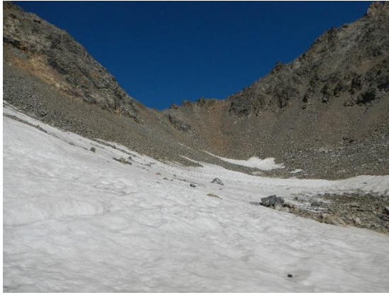
фото 10. Пер. 9го Мая(1Б, 3713м) с востока.

Перевальная седловина – небольшая площадка на 8-10 человек, тур с северной стороны.