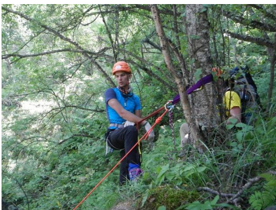
фото 20. Спуск участников в д/р Черек