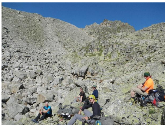
фото 13. Группа на фоне пер. Обходной(1А, 3458м).

Подъем группы в 5.00. Выход в 7.00. С места ночевки пер. Обходной хорошо просматривался. Группа перешла вброд ручей Укю и начала подъем по северному (справа по ходу) склону, травяной покров постепенно переходит в осыпь. Группа в 9.20. была на пер. Обходной(1А, 3458м). Это не перевал, а именно обход нижней части ледника, стекающего с в. Укю.