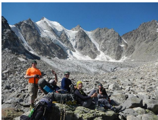
фото 14. Группа на пер. Обходной(1А, 3458м).