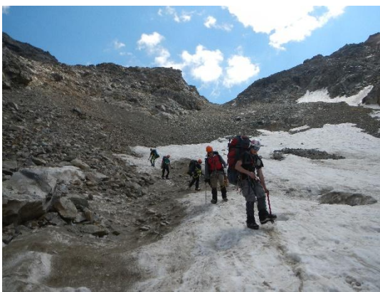
фото 12. Спуск с пер. 9го Мая(1Б, 3713м) на запад.