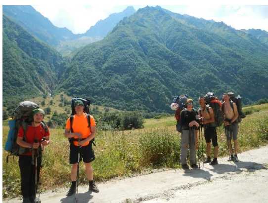
фото 26. Группа на фоне д/р Жюрюскюсу.

Подъем группы в 7.30. Выход на маршрут в 10.00. Из а/л Безенги по грунтовой дороге группа направилась вниз, в сторону поселка Безенги, вдоль реки Черек-Безенгийский.