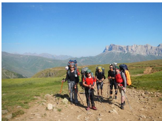
фото 29. Группа в долине реки Удурсу.

Подъем группы в 7.00. Выход в 9.00. Группа двигалась по дороге.