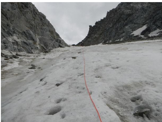
фото 17. Вторая веревка на пер. Янгеля(2А, 3689м), фото с севера.

В 12.10 начали спуск, 30 метров осыпи группа преодолела в плотном движении, порой пришлось передвигаться боком и в «три такта». На льду была приготовлена 1ая станция(12.35.), на спуске провесили 3 веревки, средний угол 40^{\circ} - 50^{\circ} , закончили спуск в 15.40.