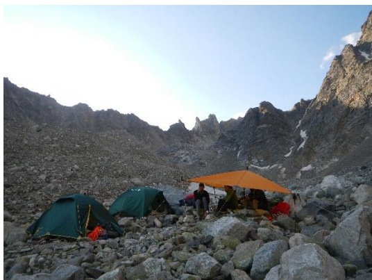
фото с юга.