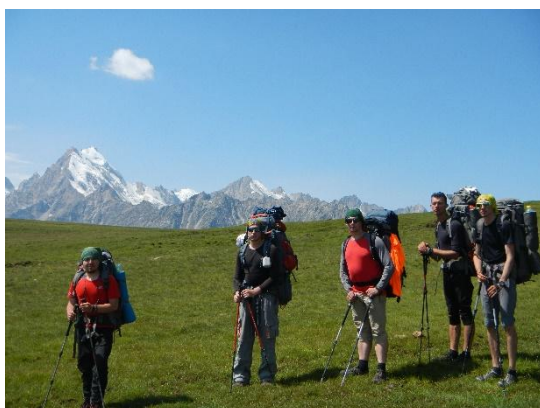
фото 30. Группа на перевале Думала(н/к, 2997м).

В 10.35 группа вышла на перевал Чегетджар(н/к, 2988м), сам перевал – еле заметное понижение в хребте. Он соединяет д/р Удурсу с запада и д/р Чайнашки с востока. За перевалом группа спустилась в урочище Хогес, оказалась на перевале Думала(н/к, 2997м), затем на перевале Чепуралы(н/к, 2952м), оба перевала еле заметны на покатых склонах. По тропе дошли до коша, высота 1820м.