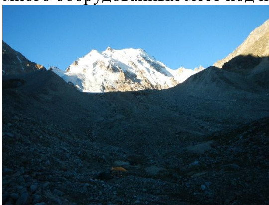
фото 3. Ночевка группы на высоте 3127 м под конечной мореной ледника Укю.

От места ночлега шли до 11.00, обед на высоте 2800 м в хорошем месте, много оборудованных мест под палатки. Солнечно.