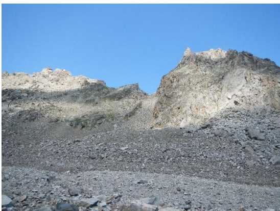
фото 15. Пер. Янгеля(2А, 3689м), фото с юго-востока.

В 9.50. группа продолжила движение в сторону пер. Янгеля(2А, 3689м).