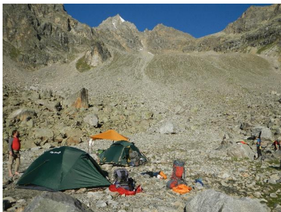
фото 9. Группа под пер. 9го Мая(1Б, 3713м).

В 10.15 подошли к водопаду – это отличный ориентир для подъема к перевалу 9го Мая(1Б, 3713м). Тропа (очень крутая) начинается слева от водопада, затем поднимается над ним и теряется в траве на склоне. В 12.40. группа поднялась на висячую долину перед перевалом 9го Мая(1Б, 3713м). Есть хорошие места для ночевки. Решили пообедать, начиналась гроза. Выше по описанию стоянок не было, после обеда и грозы было поздно идти на перевал. Поставили палатки и заночевали.