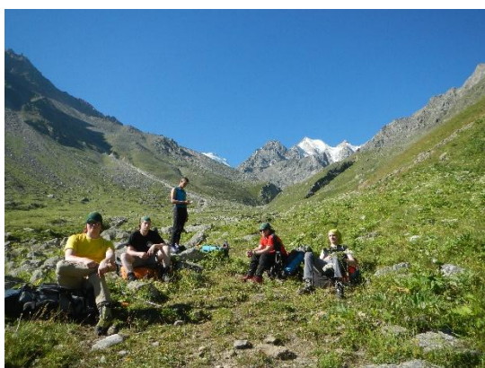
фото 2. Группа в верховьях р. Думала.

Подъем группы в 5.40, выход на маршрут в 7.30. Подъем в верховье долины р. Укюсу проходит по левому борту, есть хорошо натоптанная тропа.