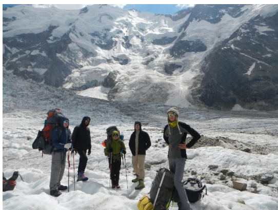
фото 21. Участники на фоне г. Джангитау в Безенгийской стене.

Подъем в 5.10, выход в 7.30. Тропа через калитку в северо-западной части а/лагеря, от главного корпуса, приводит на маренную часть Безенгийского ледника. В 7.50. группа была остановлена пограничниками для проверки документов. В 8.20. группа продолжила движение по правобережной марене. В 10.00 группа вышла на открытую часть ледника, маршрут проходит по центральной части ледника, в юго-западном направлении.