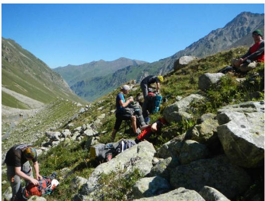
в д/р Думала на юг.

Подъем группы в 6.30, выход на маршрут в 8.50. В д/р Думала тропа проходит по верху левобережной морены.