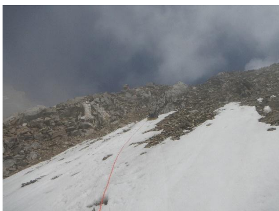
фото 24. Первая веревка при подъеме на пер.

Подъем группы в 5.30. Выход в 7.30. Группа двигалась по альпинистской спусковой тропе по направлению к в. Башхааус-баши. Через переход привал, группа обвязалась и связалась, еще 1 переход прошли в связках, бергшрунт под перевалом группа обошла слева по ходу. Перевал МВТУ (2А, 4110 м) находится в северном отроге ГКХ и соединяет с запада восточную часть Безенгийского ледника и с востока – ледник Башхааус. С запада перевал представляет собой 40°-45° ледовый склон в нижней части и скальный, сильно разрушенный пояс вверху. В 10.00. первая станция на льду. Пройдя 50 метров 1ый участник оставил рюкзак на ледобуре, так как очень неудобно было лезть. На подъеме, со стороны Безенгийского ледника, стояло много льда и снега, обнажились камни, сильно разрушенные скалы, много «живых» камней. Вторую станцию участник смог сделать на противоположном склоне перевала(практически полностью отсутствовала монолитная скала, не было мест, трещин для организации командной страховки). В 12.00. группа была на перевале МВТУ(2А, 4110м).